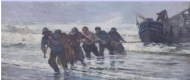
Flobart tiré vers la plage après la pêche

Le musée de Berck est particulièrement intéressant car, non seulement il présente des œuvres de l'École de Berck, (Boudin etc) mais c'est aussi un des rares musées archéologiques sous fluvial de France ; en effet les pièces présentées résultent des fouilles des rivières dans lesquelles on jetait un peu tout auparavant...même des objets volés. Outre de magnifiques marines de Laverazzi, vous pourrez admirer la collection des trognons de Tattegrain..... réalisés au début du 20ème siècle dans l'hospice de la ville (83).