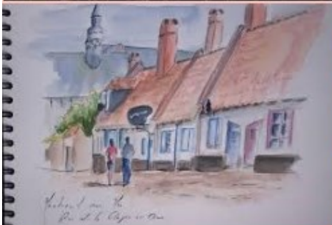
Rue du Clape en bas

Ville typique à l'histoire riche, principalement connue pour ses fortifications et ses remparts datant des XIII e et XVI e siècles, elle est devenue l'un des principaux lieux touristiques de la région et a reçu de nombreux labels. Certes, ce n'est pas Carcassonne, mais ses remparts et sa citadelle sont intacts et vous en ferez facilement le tour. Flâner à l'intérieur de la ville vous permettra de découvrir les rues pentues, et la délicieuse « rue du clape en bas ». N'oubliez pas vos pinceaux, sujets garantis. Vous croiserez peut être l'ombre de Jean Valjean devenu, grâce au village au pied des remparts, monsieur Madeleine ; Chaque été « les Misérables » y sont joués, et si vous êtes amateurs de brocantes et d'antiquités vous serez au paradis. Impossible ici de vous raconter « Montreuil-sur-mer (les bateaux remontaient jusqu'à ses pieds au moyen âge) tant son histoire est riche, l'office du tourisme le fera beaucoup mieux..